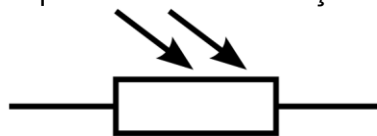
Symbole d'une photorésistance

Une photorésistance est un composant électronique dont la résistance électrique R , exprimée en ohm ( \Omega ), varie en fonction de la quantité de lumière reçue.