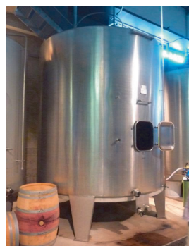
Cuve de vinification en inox

Le but de cette épreuve est de déterminer la teneur en fer dans un vin blanc pour savoir s'il est commercialisable.