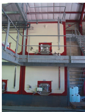
Cuve en béton tapissée de céramique

Si la quantité de fer présente est trop importante, le vin devient non commercialisable. Chaque vigneron doit ainsi maîtriser la quantité de fer contenue dans son vin au cours de son élaboration.